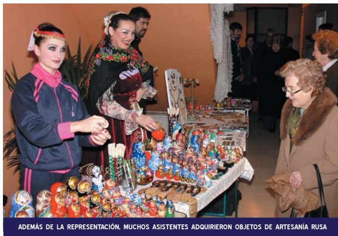
ADEMÁS DE LA REPRESENTACIÓN, MUCHOS ASISTENTES ADQUIRIERON OBJETOS DE ARTESANÍA RUSA

La aclamada obra, programada por la Concejalía de Cultura del Ayuntamiento de Pinoso, se representó en la tarde del domingo 29 de enero.