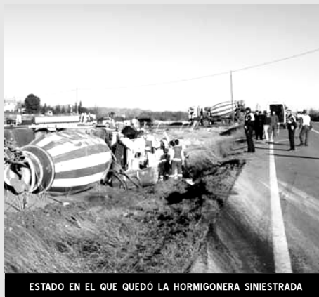
ESTADO EN EL QUE QUEDÓ LA HORMIGONERA SINIESTRADA

El 19 de enero, en la carretera comarcal Pinoso-Yecla, a la altura del Paredón, un camión de la empresa Hormigones Trijusa se salía de la calzada. Hasta el lugar de los hechos se desplazaron una unidad del Parque de Bomberos de Elda, Policía Local, Guardia Civil y 2 unidades del SAMU. Sólo una de ellas procedió a reanimar al herido, allí mismo. El conductor del camión, vecino de Jumilla de 42 años, quedó atrapado en la cabina, pero afortunadamente su estado no reviste gravedad.