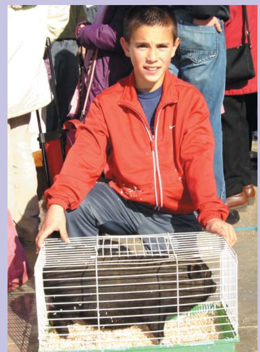
Entre els animalets més estranys va estar un porquet vietnamita, que va portar el patufet de la foto dins una gàbia.

Ací teniu una colla de patufetes molt divertides, amb les seues peixeres a la ma. La més gran per a una tortuga i la més xiqueta per a un peix taronja.