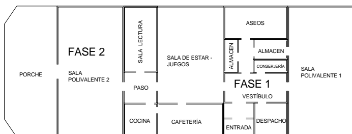
CON ESTA ACTUACIÓN RENACERÁ UN NUEVO CENTRO. AMPLIADO EN 200 METROS CUADRADOS. CON DOS SALAS POLIVALENTES

En una segunda fase, prevista para 2007, se construirá la sala polivalente nº 2, que se situará en el extremo opuesto. Tendrá su acceso por la sala de estar del módulo central, previo paso por un vestíbulo intermedio y dispondrá de salidas directas al exterior. A continuación de la sala polivalente nº 2, se proyecta el porche descubierta que estará