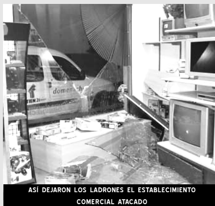
ASÍ DEJARON LOS LADRONES EL ESTABLECIMIENTO COMERCIAL ATACADO

Los agentes realizaron varias batidas por las ca-