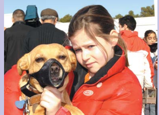
Aquesta xiqueta va posar-li el morrió al seu gos, per a que no li fera res als companys i a la resta d'animallets.

Un gosset i una tortuga van ser els animalets que van portar a beneir estes patufetes tan guapes.