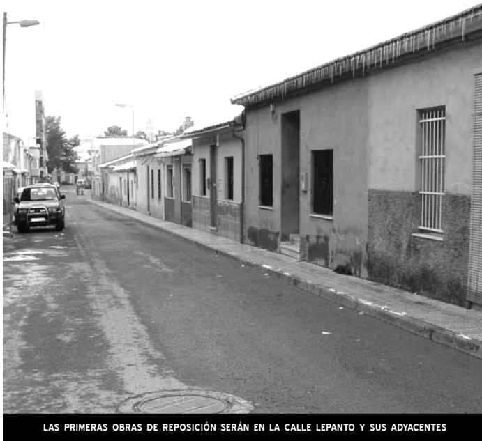
LAS PRIMERAS OBRAS DE REPOSICIÓN SERÁN EN LA CALLE LEPANTO Y SUS ADYACENTES