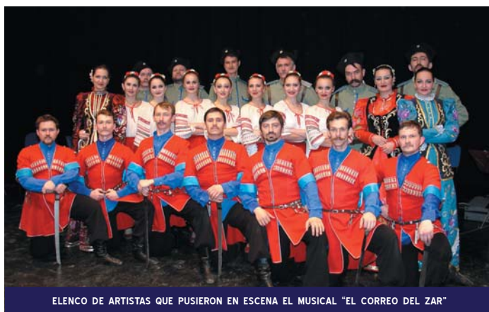
ELENCO DE ARTISTAS QUE PUSIERON EN ESCENA EL MUSICAL "EL CORREO DEL ZAR"