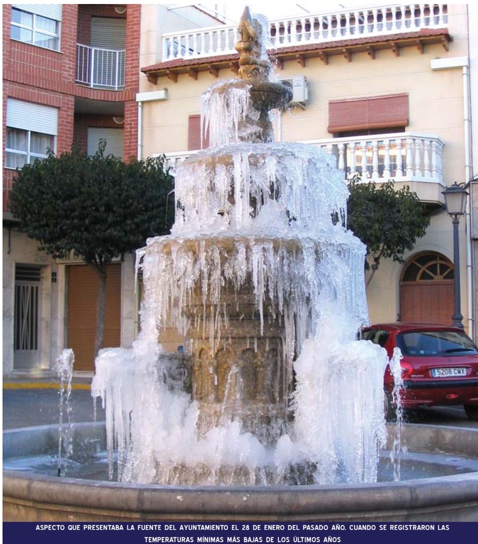
ASPECTO QUE PRESENTABA LA FUENTE DEL AYUNTAMIENTO EL 28 DE ENERO DEL PASADO AÑO. CUANDO SE REGISTRARON LAS TEMPERATURAS MÍNIMAS MÁS BAJAS DE LOS ÚLTIMOS AÑOS

Así mismo, la niebla estuvo presente durante 30 días. Las heladas se prolongaron por espacio de 56 días, mientras que 243 días los cielos estuvieron despejados.