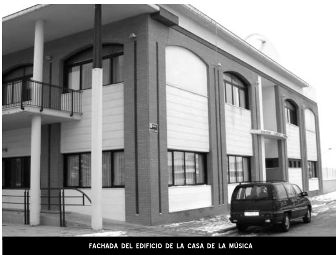
FACHADA DEL EDIFICIO DE LA CASA DE LA MÚSICA

La actuación a realizar en el edificio de la Casa de la Música es, realmente, una obra urgente y necesaria.