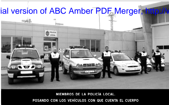
MIEMBROS DE LA POLICÍA LOCAL. POSANDO CON LOS VEHÍCULOS CON QUE CUENTA EL CUERPO