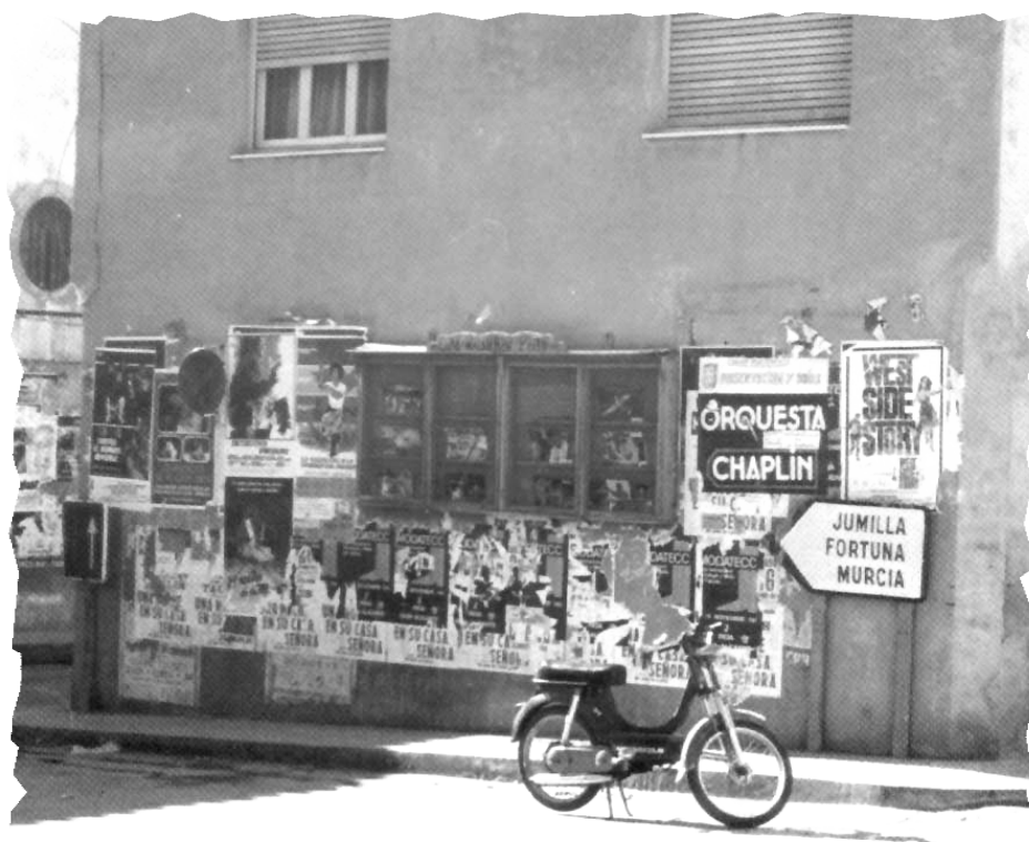
LA CARTELERA DEL CINE. ILUSIONES PARA UN VIAJE A HOLLYWOOD