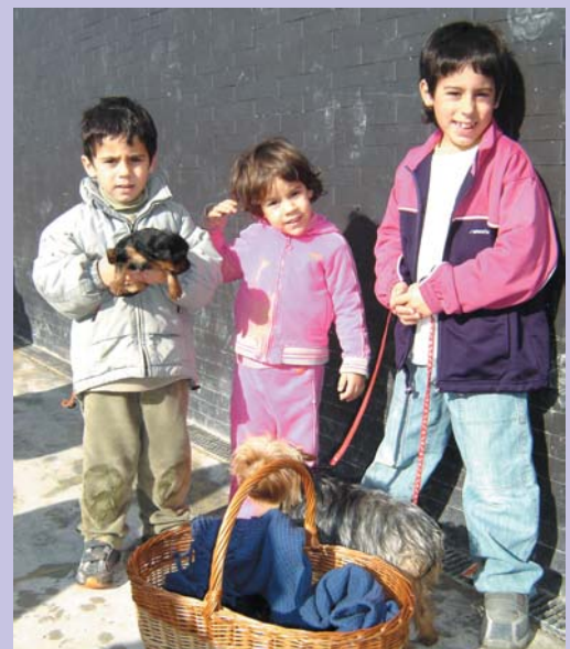
Fins en una cistella com la que veieu ací van apropar-se els gossos a la benedicció de Sant Antoni.